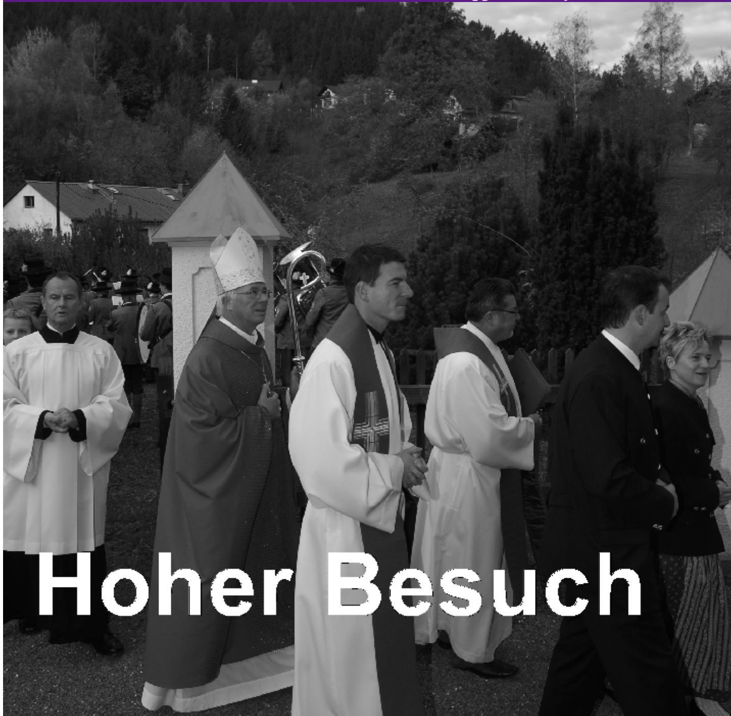
Weibischof Dr. Franz Lackner, Sonntag, 19. Oktober in Kirchdorf

Das Pfarrblatt für den Pfarrverband Bruck/Mur - Pernegg - St. Dionysen-Oberaich