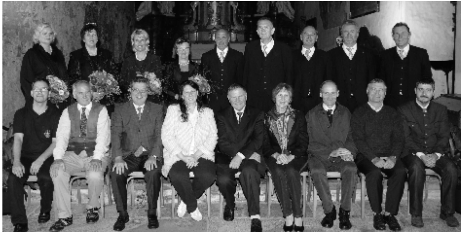
Nove Cantori mit Mitgliedern des Kuratoriums in der Minoritenkirche.