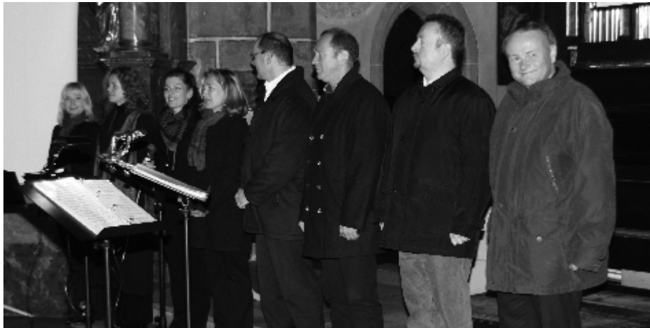
Das Ensemble 8-Klang Frohnleiten bei der Abschlussveranstaltung zum Hugo-von-Montfort-Gedenkjahres in der Stadtpfarrkirche.