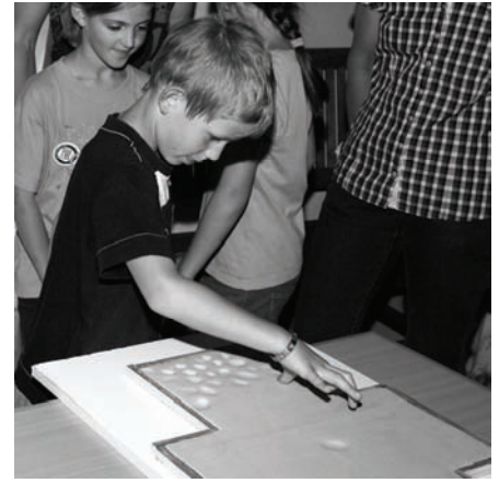
Kirchenbesucher hinterließen ihre Fingerabdrücke auf einem Tonkreuz