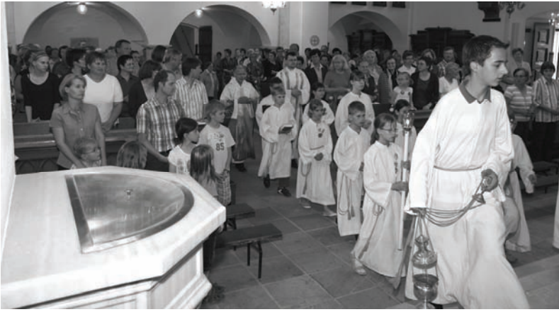
Ein festlicher Gottesdienst, gestaltet vom Gesangverein und Vokalensemble, wurde gefeiert.