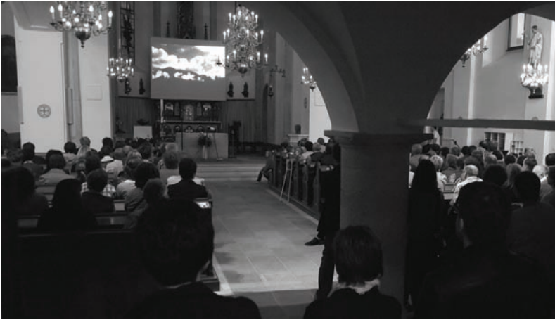
Ein Konzert des Vokalensembles mit meditativen Gesängen zu Vaterunser und Ave Maria und wundervollen Stimmungsbildern auf eine große Leinwand im Altarraum projiziert, ließ die Kirchenbesucher zur Ruhe kommen.