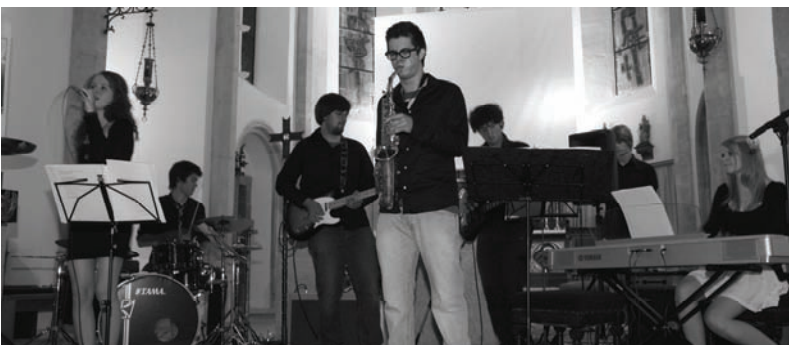
Für den musikalischen Ausklang sorgte die Band "Tolerance".