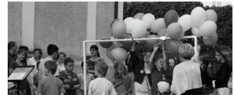
Für die Kinder gab es eine Kirchenrallye mit vielen Stationen, wie etwa das Kennenlernen der Orgel.

Für die ganz Kleinen gab es eine Kinderecke mit Stofftieren, Bibelgeschichten und die Möglichkeit zum Malen.