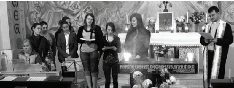
Es gab auch eine Jugend-Vesper bei Kerzenlicht und Weihrauch in der Kalvarienbergkirche.

Bei einer Station gestalteten die Kinder Namenskärtchen, welche an Luftballons geknüpft wurden. Zum Glockengeläute stiegen die Luftballone auf.