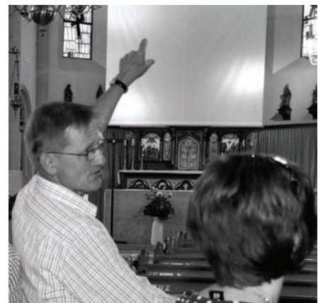
Baupläne und Fotos vom Umbau der Kirche vermittelten den Kirchenbesuchern, dass vor ca. 25 Jahren ein großer Eingriff in die Architektur des Kircheninnenraums vorgenommen wurde.