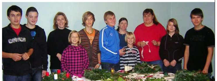
Eine andere Firmgruppe mit lieben Helfern im Advent