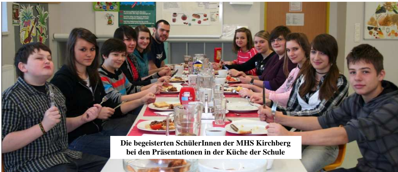
Die begeisterten SchülerInnen der MHS Kirchberg bei den Präsentationen in der Küche der Schule