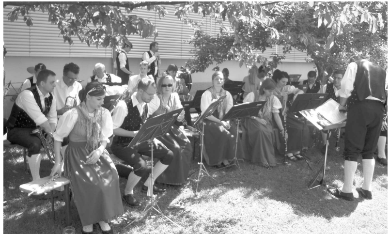
Die Marktmusik sorgte für gute Stimmung auf dem Festplatz