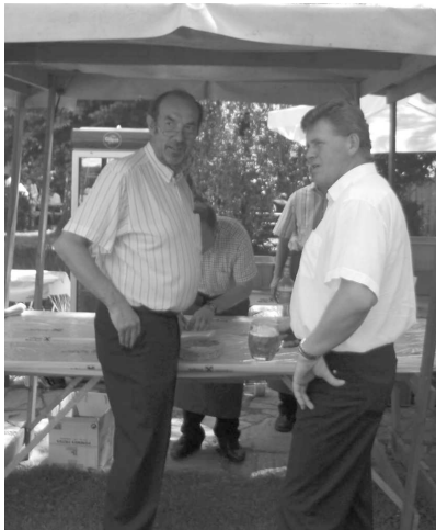
Kurze Pause am Getränkestand