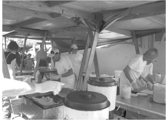
Beim Grillstand ging es rund