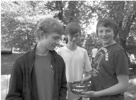
Einige unserer fleißigen Losverkäufer