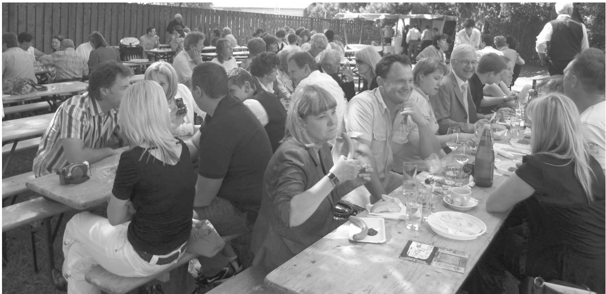
Dank schönem Wetter war unser Fest gut besucht