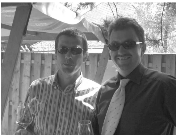
Unser kompetentes Team beim Weinstand