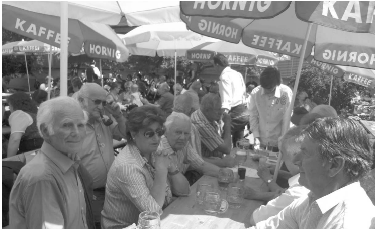
Wir hatten auch Besuch aus der Nachbarpfarre