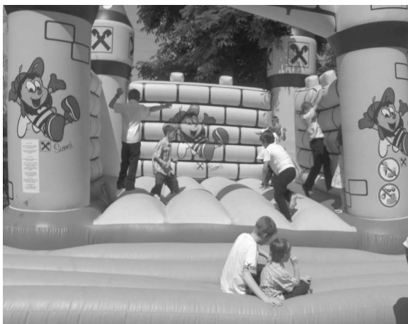
Auch die Kinder hatten viel Spaß und wurden von den Jugendlichen gut betreut