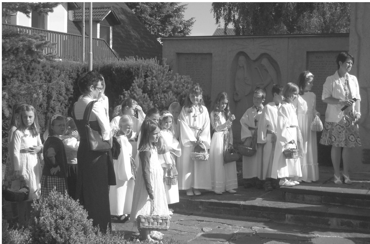
Bei der Fronleichnamsprozession wurde von den Kindern ein Kelch aus Blüten gelegt (siehe Titelbild).