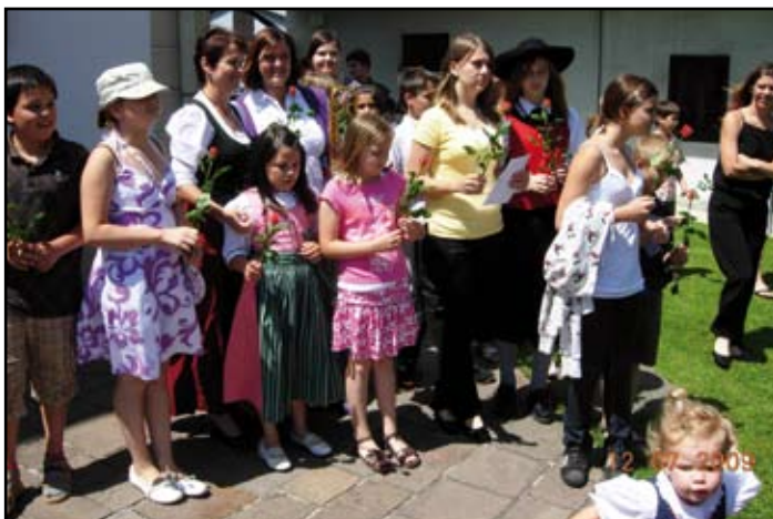
... natürlich auch die Ministranten ...