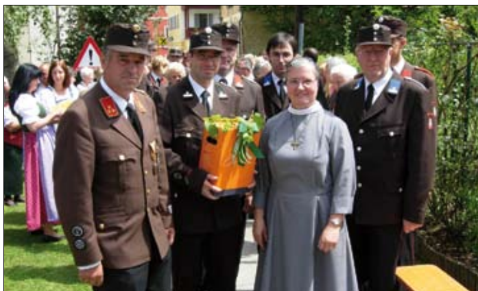
... die Freiwillige Feuerwehr Maltshach ...