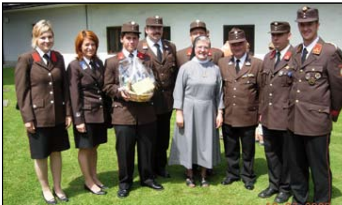
Die Freiwillige Feuerwehr Arnfels ...