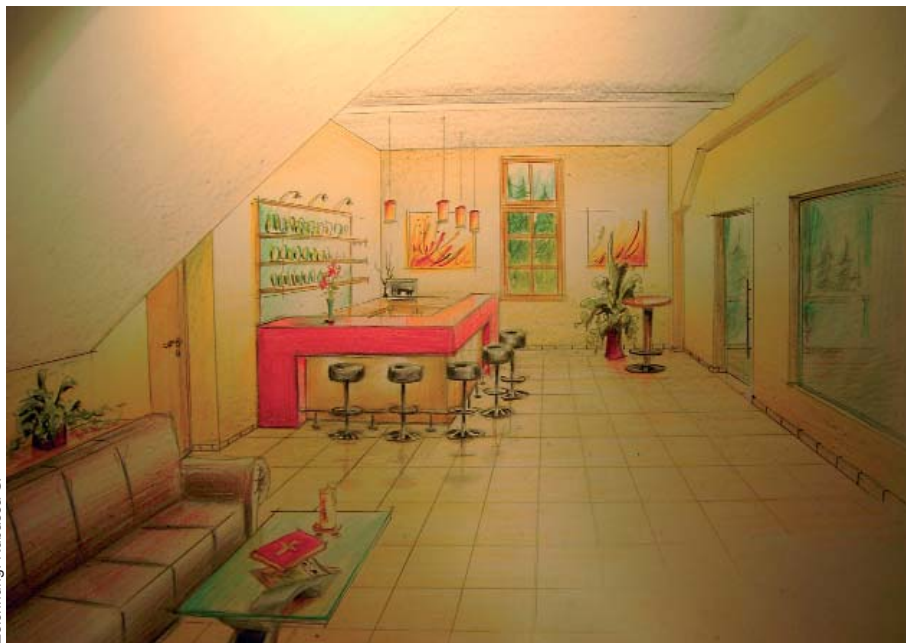
Zeichnung: Kubassa G.