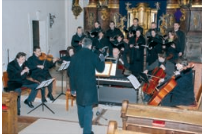
Die selten gespielte Markus-Passion von J. S. Bach wurde in Mürzzuschlag aufgeführt

Am Palmsonntag und am Ostermorgen begleitete der Eisenbahner Musikverein die festliche Prozession in die Stadtpfarrkirche. Dort gestalteten die Blasmusiker mit