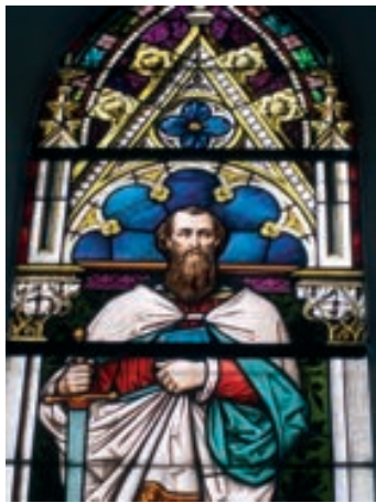
Paulusfenster in der evangelischen Heilandskirche

„Die Juden fordern Zeichen, die Griechen suchen Weisheit. Wir dagegen verkündigen Christus als den Gekreuzigten: für Juden ein empörendes Ärgernis, für Heiden eine Torheit, für die Berufenen aber, Juden wie Griechen, Christus, Gottes Kraft und Gottes Weisheit“, schreibt Paulus im Korinther-