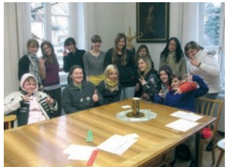
Zwei Firmgruppen bei ihrer Firmvorbereitung im Pfarrhof