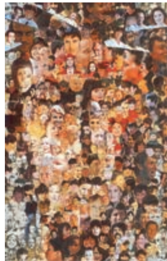
Gesicht Christi - Gesichter der Menschen

so soll auch die Kirche eine Einheit sein, in der das Mit- und Füreinander und nicht das Neben- und Gegeneinander regieren. Wie im Körper auch das kleinste Organ seine Bestimmung hat, so ist es auch in der Kirche. Hirn und Herz können genau so wenig für sich alleine leben wie Hand und Fuß. Papst und Priester können für sich alleine eben-