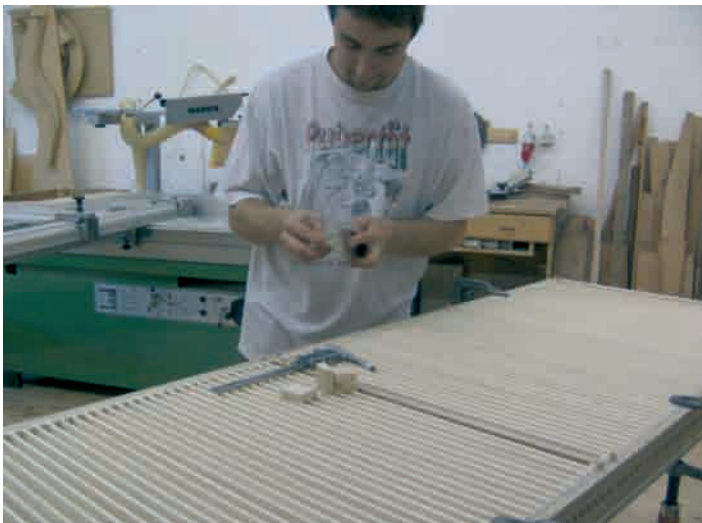
Die Mitarbeiter der Orgelbauwerkstatt Erler arbeiten bereits an der Mürzzuschlager Orgel

Bei einer Informationsveranstaltung im Mürzzuschlager Stadtsaal erklärt Orgelbaumeister Erler, wie eine Orgel entsteht.