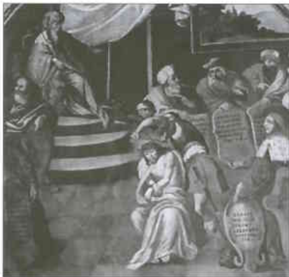
Christus vor dem Hohen Rat

Die Darstellung „ Christus vor dem Hohen Rat “ bezieht sich inhaltlich auf den Bericht der Passion Jesu, wonach Pilatus die Hohenpriester und Rats Herrn zum Prozess vorlädt (Lk 23,13). Unser Bild wird bestimmt durch den gebundenen, dornengekrönten und mit dem Spottgewand bekleideten Christus, der die Mitte des Geschehens ein-