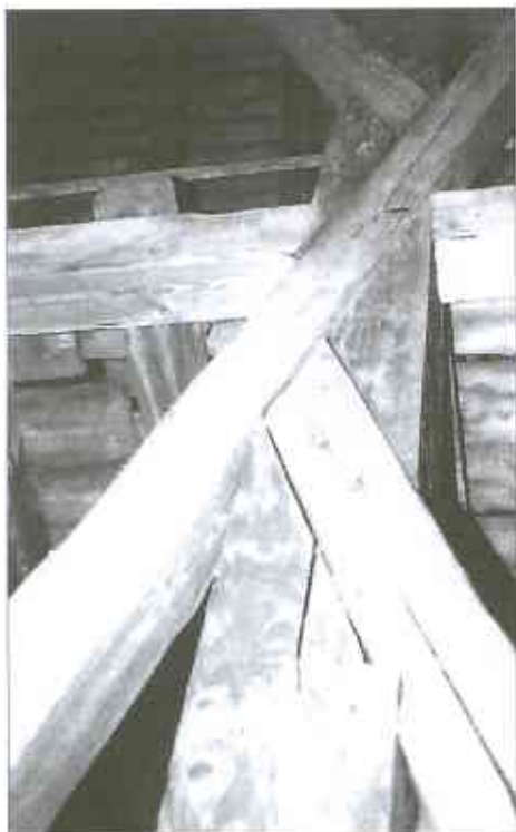
Mit Holznägeln eingebundene Streben