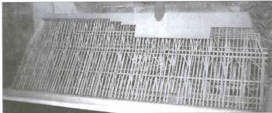
Modell des 23m hohen Dachstuhls

Verankert ist der Dachstuhl nicht, Eisen war damals wohl zu kostbar. Die mitunter erheblichen Windkräfte in dem nach Nordwesten gerichteten Tal werden von einer auf der Innenseite bis unter die Mauerbänke reichenden Holzkonstruktion aufgenommen, die auf Steinen steht, die aus der Mauer ragen. Die 18