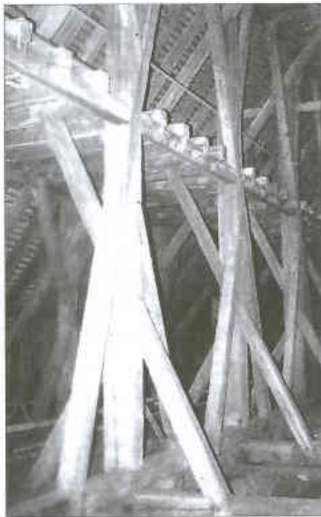
25m lange Bundbalken

Binder des Dachstuhls haben je vier Stützen.