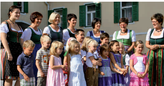
Kindergartenkinder singen dem neuen Pfarrer ein Ständchen