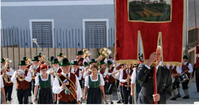
Pfarrfahne und Marktmusik führen den Einzug an