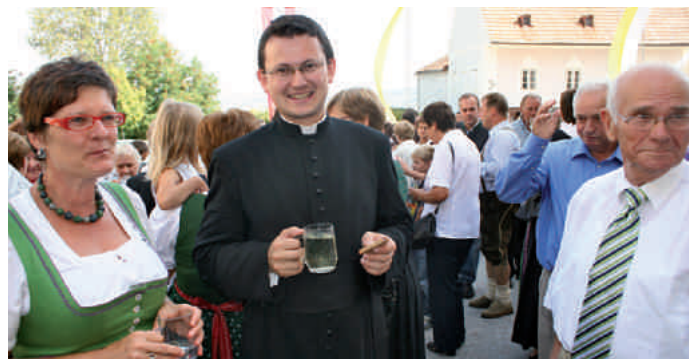
Bei der Agape und den ersten Gesprächen mit der Pfarrbevölkerung