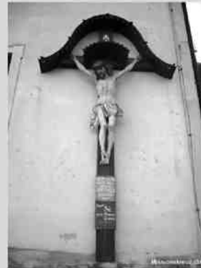
Anlässlich 820 Jahre Pfarre Straden (1188 - 2008)