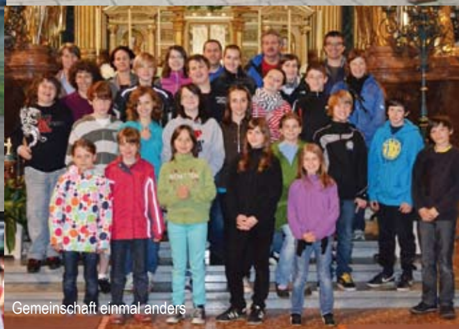
Gemeinschaft einmal anders