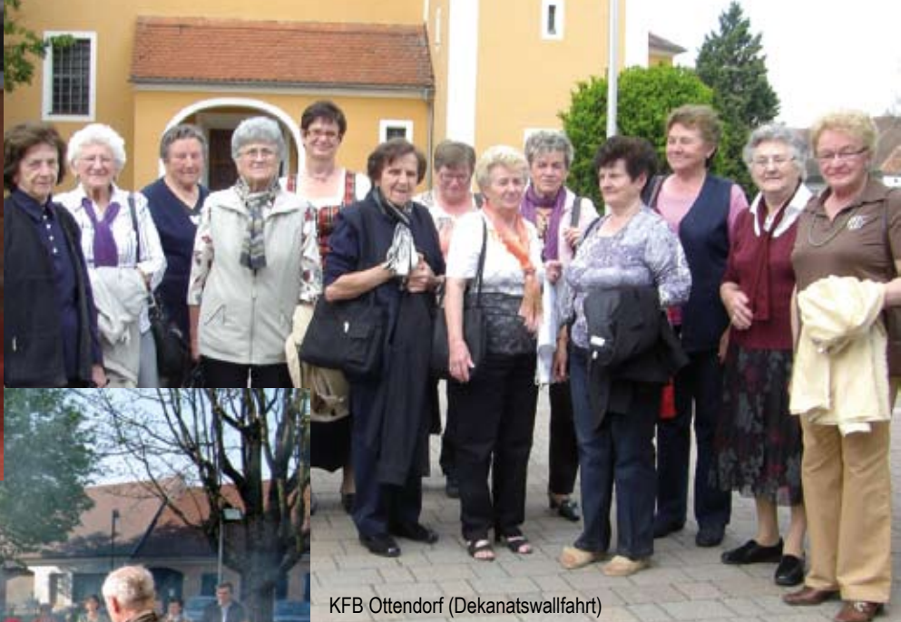
KFB Ottendorf (Dekanatswallfahrt)