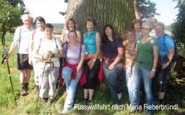
Fusswallfahrt nach Maria Fieberbründl