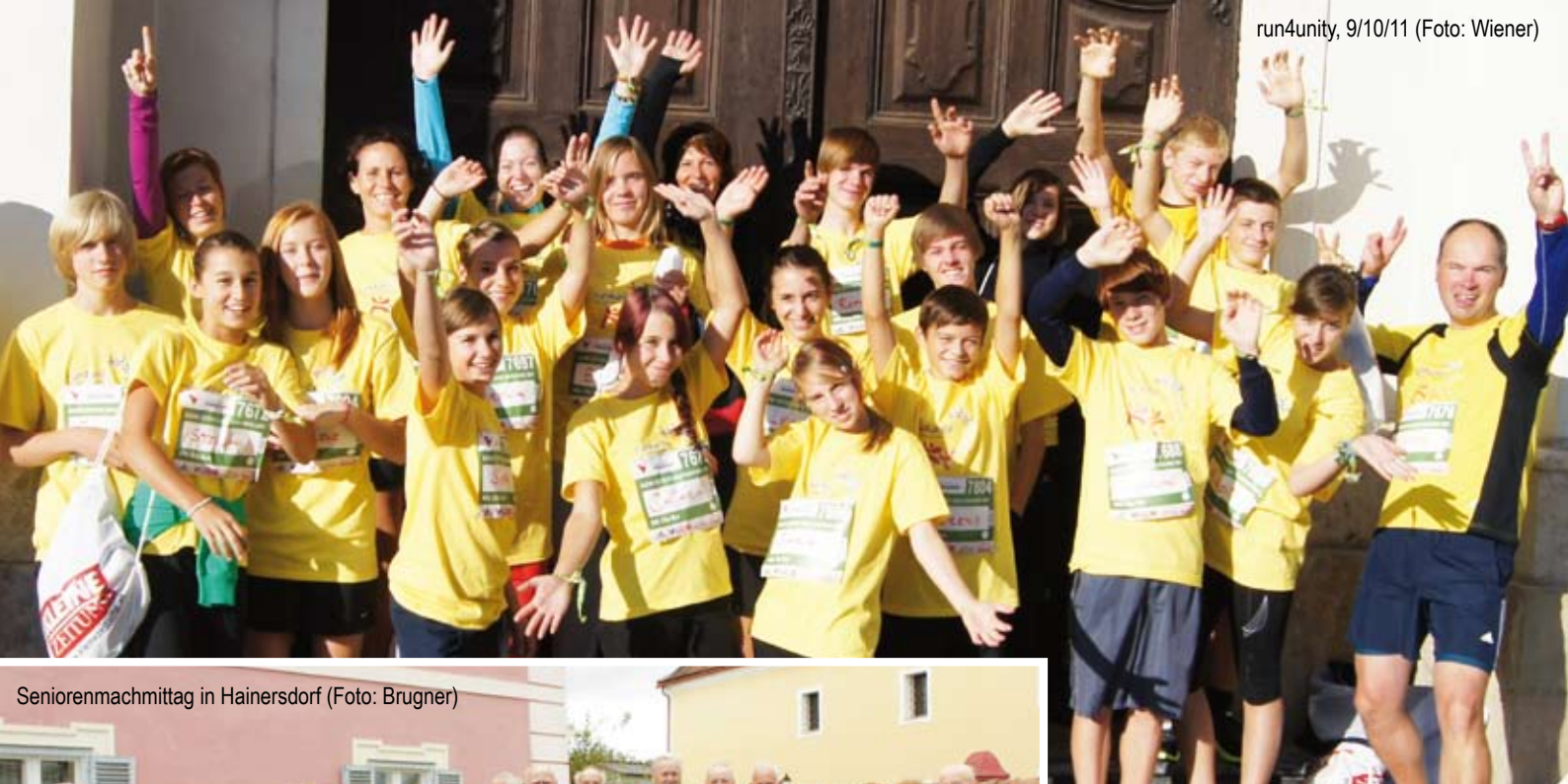
Seniorenmachmittag in Hainersdorf