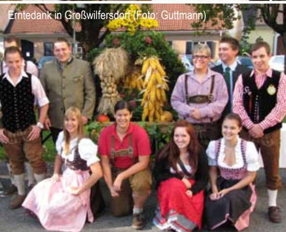
Erntedank in Großwilfersdorf