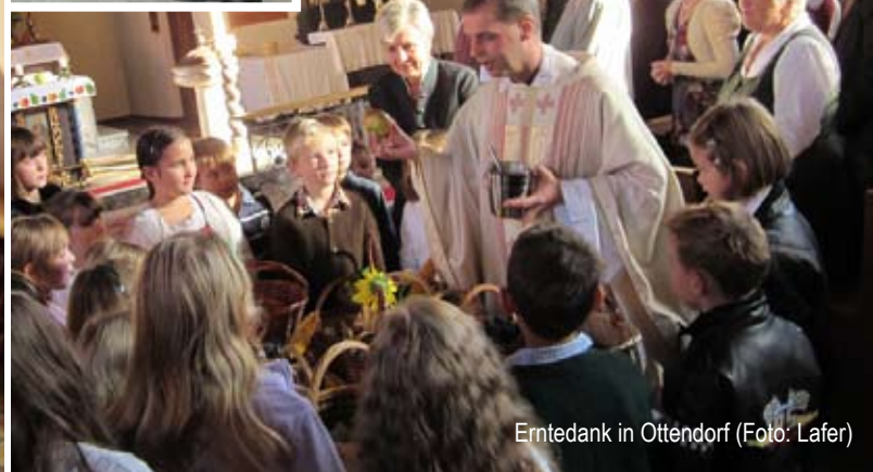
Erntedank in Ottendorf