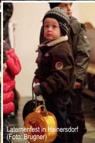
Laternenfest in Hainersdorf