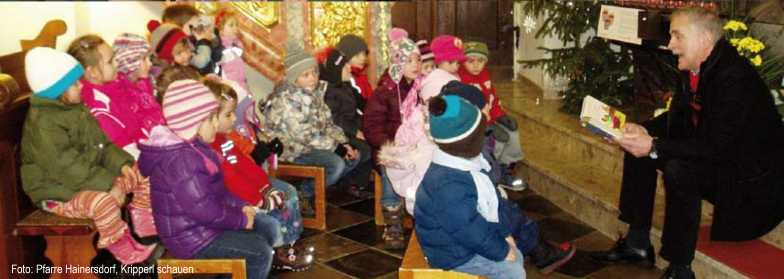
Krippel schauen