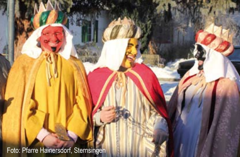
Sternsingen