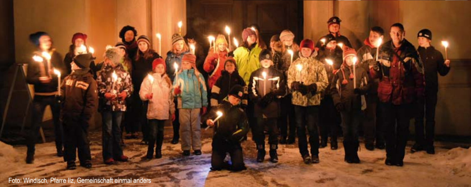
Pfarre Ilz, Gemeinschaft einmal anders