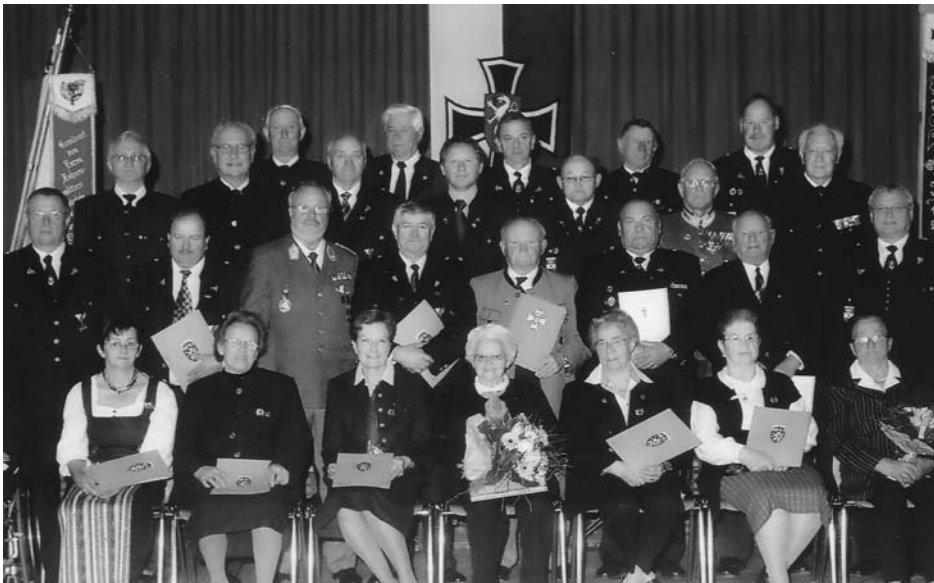
Bild: Mitgliederversammlung mit Ehrung 2009